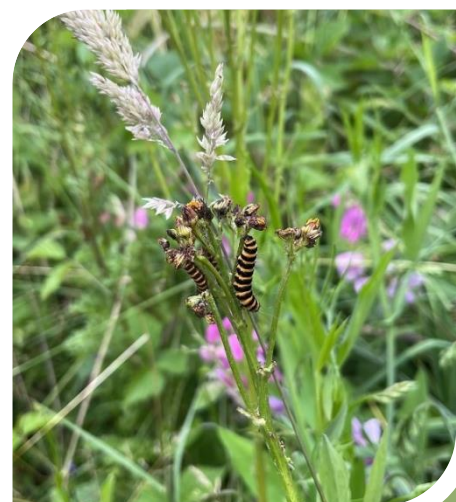
Foto: Rups Sint Jacobs vlinder

Verder waren de visdief en de wespindief nieuwe soorten voor de tuin en beide overvliegend gezien.