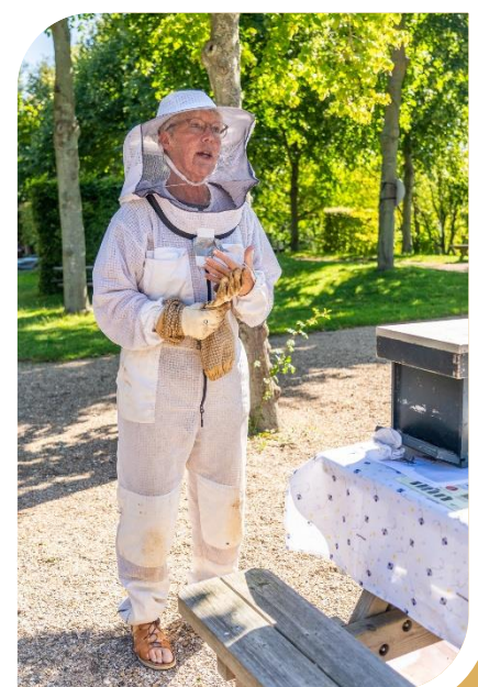
Foto: bijkletsen met de imker