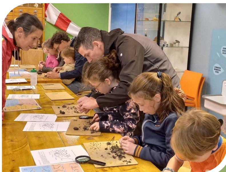
Foto: braakballen pluizen