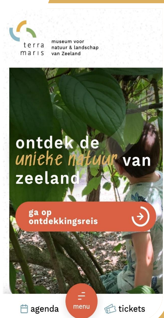
Foto: Nieuwe website

Wekelijks zijn naar alle regionale media persberichten inclusief een aansprekende foto over de komende activiteiten verstuurd.