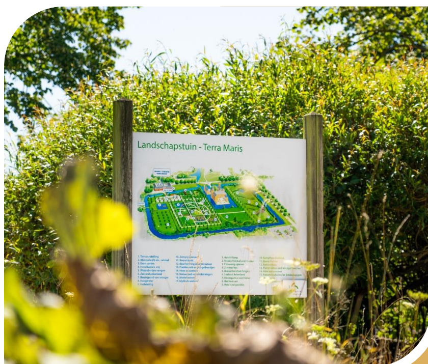
Foto: Entree museumtuin