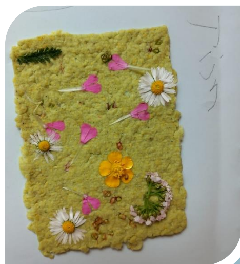
Foto: papier maken lente