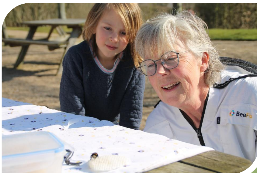
Foto: bijkletsen met de imker

In 2025 zijn 17 Imker in de Klas-gastlessen gegeven aan in totaal 383 leerlingen. Hierbij is ook gebruik gemaakt van het uitleen materiaal. Daarnaast zijn er 7 schoolgroepen met in totaal 241 leerlingen naar Terra Maris gekomen voor de Bij-les van de imker. Zij hebben ter afsluiting allemaal een Bijenhotel-to-go gemaakt.