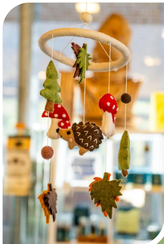
Foto: museumwinkel assortiment

In 2025 hebben we deze voor het eerst ook verkocht op het veld tijdens de middeleeuwse festijnen: jonkvrouw en ridder uitrustingen van tuniek tot schild en zwaard. Zo veranderden veel jonge bezoekers in figurant