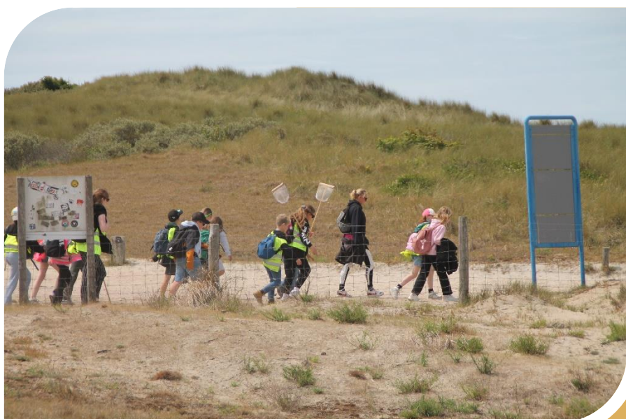
Foto: strandsafari schoolklas

Vanuit educatie is aangesloten bij het SNNC/VSC-project Leren Doe je Samen.